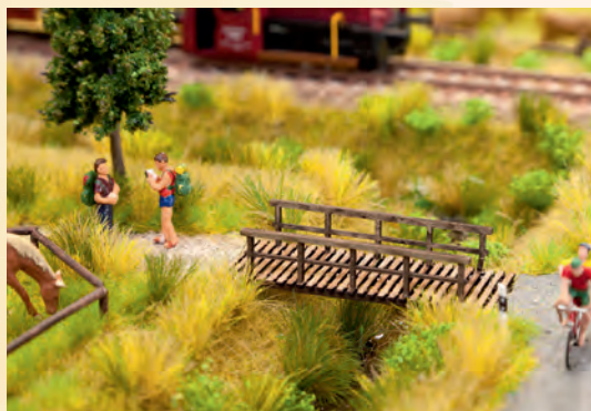
Streu gras und Streumaterial